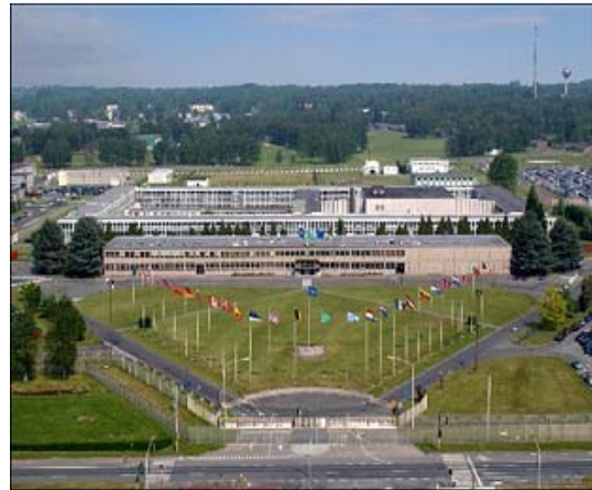
Siège de l'état-major d'ACO à Mons

Chef des représentations militaires françaises auprès des Comités militaires de l'UE et de l'OTAN . Conseiller militaire des Ambassadeurs auprès du COPS et auprès du Conseil de l'Atlantique Nord .